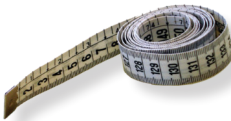
Metro a nastro

In questo documento illustriamo qual è il metodo per rilevare i valori in maniera tale da ottenere un preventivo di spesa attendibile.